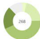
Toimenpiteiden vaiheet Käynnistettyjen ja valmiiden toimenpiteiden määrä